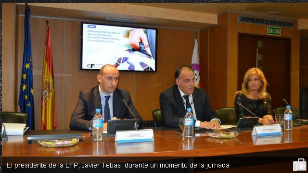
El presidente de la LFP, Javier Tebas, durante un momento de la jornada