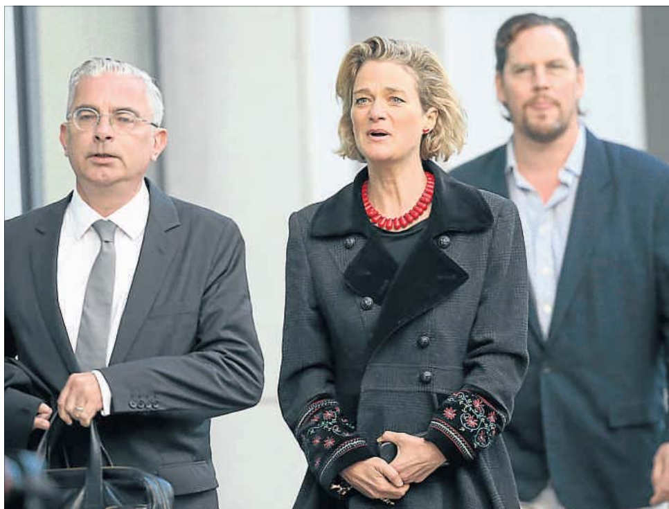
Delphine Boël. La escultora de 46 años con sus abogados, ayer a su llegada al primer día de juicio para demostrar que es hija ilegítima de Alberto II y exigir que el rey se someta a las pruebas de ADN para demostrar su paternidad

El irlandés Colin Farrell (38), intérprete de filmes como Corrupción en Miami , Alejandro Magno o Desafío total , será uno de los protagonistas de la segunda temporada de la serie policiaca estadounidense True detective , que se estrenará en verano del 2015. Farrell encarnará a uno de los tres policías (en la primera temporada eran solo dos, interpretados por Matthew McConaughey y Woody Harrelson, aunque no seguirán) que investigarán el asesinato de un hombre de negocios en una ciudad californiana.