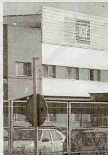
Planta de Montcada i Reixac

IAR Ibérica, fabricante de neveras y congeladores con planta en Montcada i Reixac, presentó ayer concurso de acreedores, el equivalente a la antigua suspensión de pagos, en los juzgados de Barcelona. Las deudas de la empresa ascienden a 28,4 millones de euros, según consta en la documentación firmada por el abogado Carlos Noguera, del bufete Pintó Ruiz & Del Valle. La empresa, que declaró activos por 40,2 millones, aduce problemas de tesorería derivados de la negativa evolución de las ventas y las pérdidas acumuladas en los últimos años. La dirección de IAR Ibérica, filial de la italiana IAR, pactó con la plantilla hace una semana un ERE temporal que afecta a 314 de sus 450 empleados. La compañía negocia un plan de viabilidad con Italia que permita salvar la planta catalana.