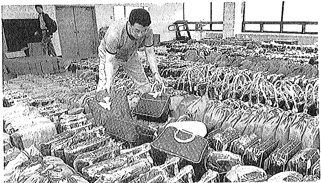
Un funcionario de policía muestra las falsificación de bolsos de Louis Vuitton confiscados en Seúl, en la Comisaría Chungyangri.

PLEITOS FAVORABLES A ROLEX Abogados de Freshfields han asesorado a Rolex en pleitos contra eBay en Alemania sobre ventas de copias on line . El Supremo alemán estableció principios sobre cuándo eBay es responsable.